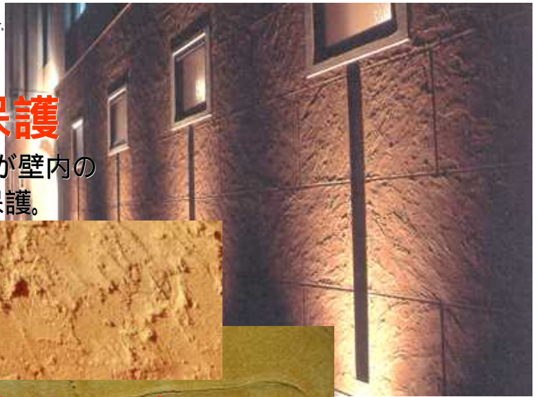
インド砂岩調仕上げの一例